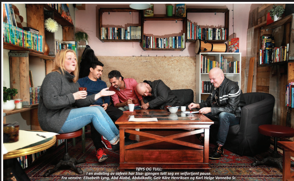
TØYS OG TULL:

I en avdeling av cafeen har Sisa-gjengen tatt seg en velfortjent pause.