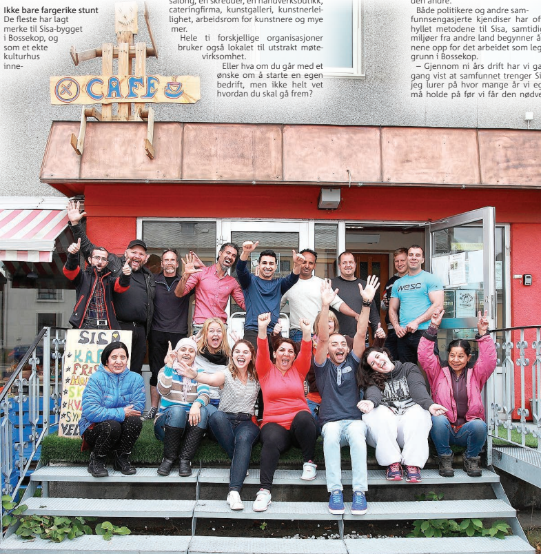
SISA-GJENGEN: I dag, 16. september, åpner denne interessante gjengen butikken i Bossekop, der de blant annet reklamerer med matmarkedssalg, eventyrlav og bruktals samt mange andre spennende aktiviteter.

Perfekte lokaler Etter noen år i sporadiske lokaler rundt omkring i byen fant kultursenteret endelig det perfekte bygget. Den gamle Alta Bok og Papir-gården i Bossekop ble lagt ut til salg og styret i Sisa AS øynet et lite håp.