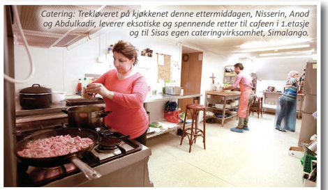
Catering: Trekkløvert på kjøkkenet denne ettermiddagen, Nisserin, Anod og Abdulkadir, leverer eksotiske og spennende retter til cafeen i 1. etasje og til Sisas egen cateringvirksomhet, Simalango.