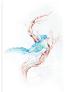
FR SOM FUGLEN: – Det er slik jeg ønsker å føle meg.