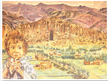
FAVORITT: – Det må bli dette bildet om jeg skal plukke ut ett. Sårbarheten til gutten som står foran den store Buddha-figuren tittaler meg sterkt, forklarer kunstneren.