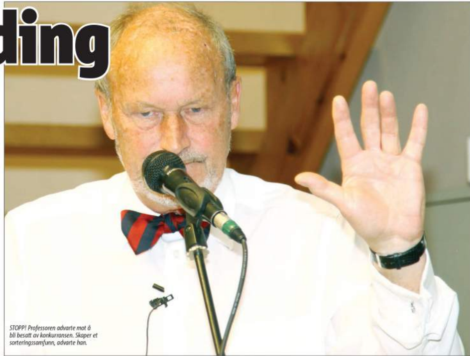
STOPP! Professoren advarte mot å bli besatt av konkurransen. Skaper et sorteringssamfunn, advarte han.