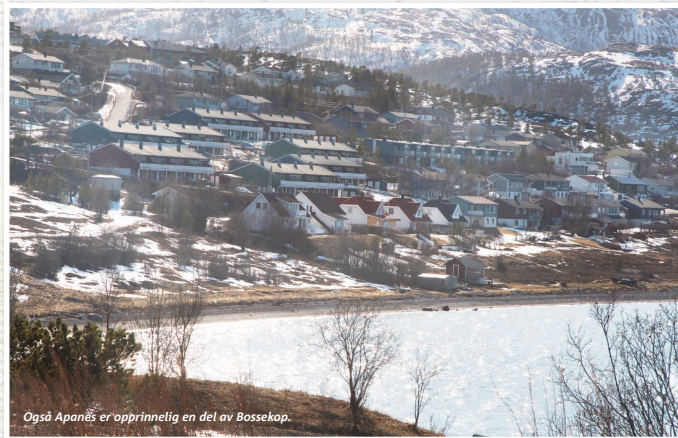
Også Apanes er opprinnelig en del av Bossekop.

Baasekop-viig Navnet Bossekop ble første gang