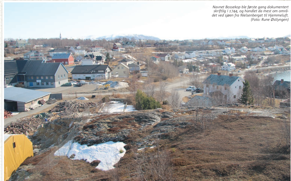
Navnet Bossekop ble første gang dokumentert skriftlig i 1744, og handlet da mest om området ved sjøen fra Nielsenberget til Hjemmeluft.

Matrikkel fra 1873 Ovenstående navneforståelse underbygges nærmere 100 år senere av hvilke navn som ble valgt på matrikkelområdene i den nye eiendomsatrikkel som ble innført for Alta i 1873. I denne var Alta inndelt i flere større matrikelområder hvor hver eiendom i disse områdene har løpenummer innenfor det aktuelle matrikelområ-