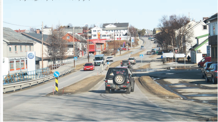
Dagens Bossekop handler mest om det som er oppå bakken, og ikke fjæralinja.

Mange av de som gikk ut av skolen for 50 år siden flyttet senere fra Alta og har bodd det meste av sine liv andre steder. Når vi møtes til sommeren er jeg overbevist om at det ikke vil gå lenge før vi alle har funnet fram til vår felles identitet – gamle bossekoppinger.