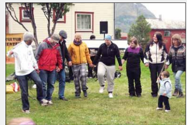
LETT PÅ LABBEN: Arabisk dans falt i smak hos de som turte prøve.

Det var forrige torsdag at en flokk på nærmere tretti Sisa-brukere og høgskolestudenter dro utover for å ha det trivelig i lavvo i parken vis a vis rådhuset i Øksfjord. Studentene er førstestårs sosionomstudenter, og fra vårt flerkulturne