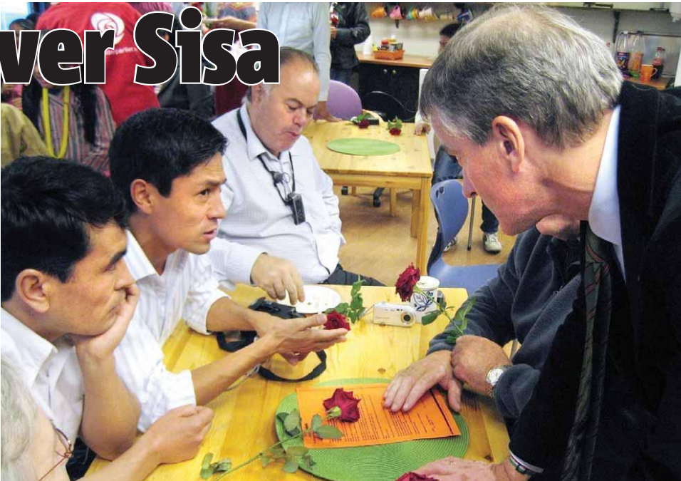
TRIVDES HOS SISA: Jonas Gahr Støre var i sitt rette element da han besøkte Sisa kultursenter på onsdag.

– Vi skal skape arbeidsplasser for asylsøkere, reparere datamaskiner, starte med re-design av kler og begynne med leksehjelp. Sisa er ikke et sted der man sitter passiv og mottar hjelp. Vi skaper aktivitetene selv, sier Sisa-lederen.