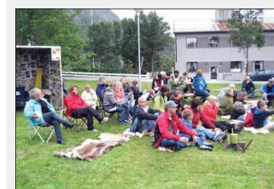
BLANDET DRØPS: Studentene kom fra hele landet og fra Sisa som det folk fra hele verden. Også øksfjordingene kom innom parken og fikk smakebiter av eksotisk sang, dans og mat.

– Dette fristet til gjentakelse. Noe som helst, avrunder Vannebo. ■ Vi tar med at campen ble arrangert av Sisa kultursenter og Høgskolen i Finnmark, institutt for sosialarbeiderutdanningene.