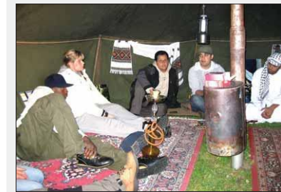
POPULÆRT: Palestina-lavvoen samlet mye folk, hvor det var sang, dans og tradisjonell mat i tillegg til bildestilling.