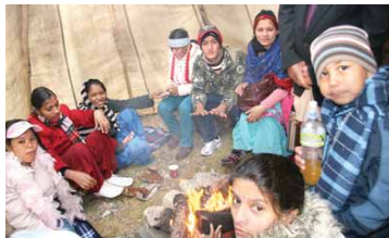
GODT MED LAVVO: Hva gjør det om det kommer en og annen regnbyge så lenge man har en varm lavvo å krype inn i. Fykingene fra Nepal lot til å kose seg i Kviby.