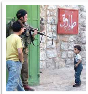
VÅPEN MOT BARN: Denne lille gutten har ikke mye å stille opp med mot soldatene ved sjekkpunktene.