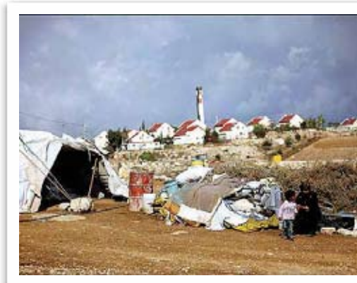
BOR I TELT: Det er lenge siden husene deres ble bombet. Fortsatt lever mange i telt på stranden.