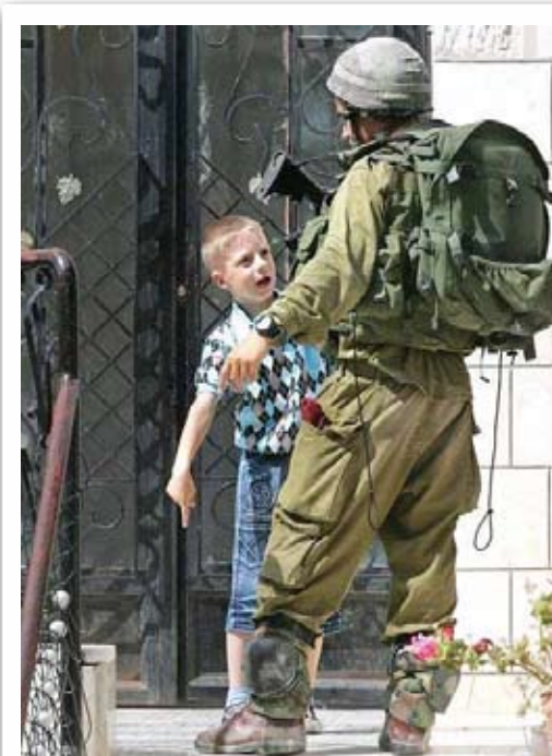
SJEKKPUNKT: For å komme gjennom byen, må man passere mange sjekkpunkt. Her blir en palestinsk gutt kontrollert av israelske soldater.